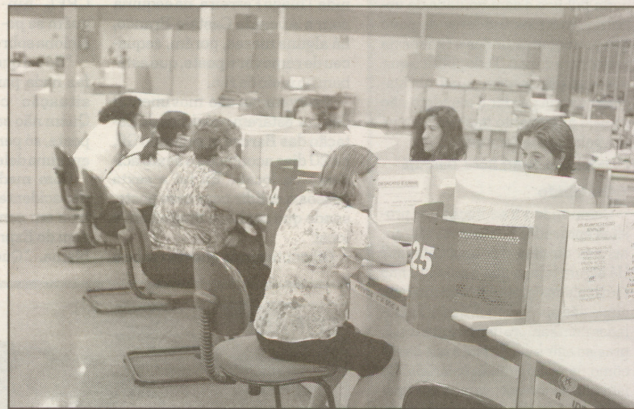
Entre Guarujá e Registro existem sete agências do INSS, onde trabalham 320 funcionários

Porém, uma liminar (decisão provisória) concedida pelo ministro do Superior Tribunal de Justiça (STJ), Og Fernandes, decidiu que a paralisação dos servidores é ilegal e abusiva. O ministro determina a suspensão do movimento para evitar prejuízos à população e estabelece multa diária de R$ 100 mil em caso de descumprimento