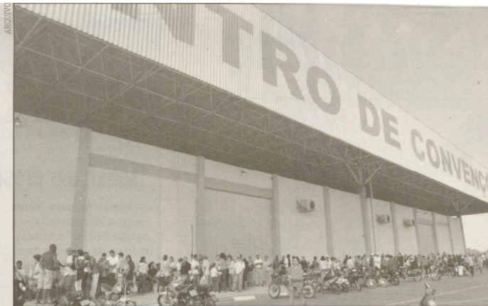
Em São Vicente, mais de 9 mil pessoas já se cadastraram na tentativa de conseguir uma moradia

A cidade com maior número de inscritos é Guarujá. Segundo a assessoria de imprensa, 42.300 pessoas já se cadastraram. As inscrições terminaram em 28 de maio.